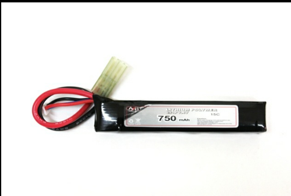
3)LI-PO 750Mha da 7,4V - 15C Sdoppiata in 2 Elementi distinti